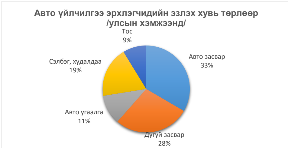
График1: Улсын хэмжээнд авто үйлчилгээ эрхлэгчидийн эзлэх хувь

Улсын хэмжээнд авто үйлчилгээ эрхэлж буй нийт 2222 иргэд, байгууллагын 20% нь аж ахуйн нэгж, 80% хувь хүн иргэн байна.