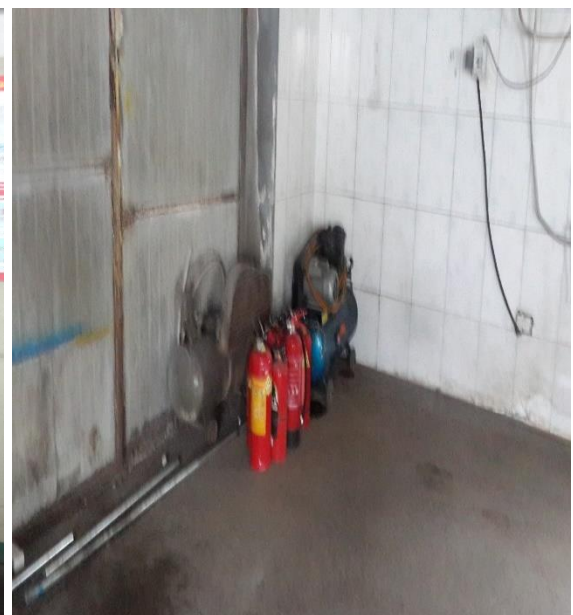
Нийслэл дэх ААНБ-ын галын булан