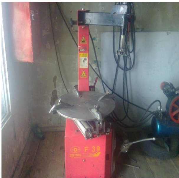
Архангай аймгийн дугуй задлагч