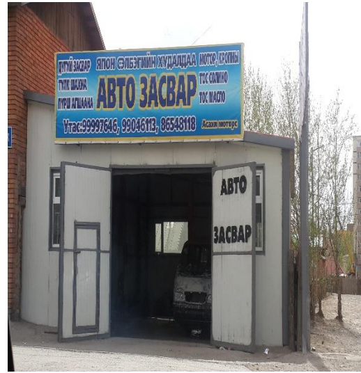
Чингэлтэй дүүргийн авто засвар