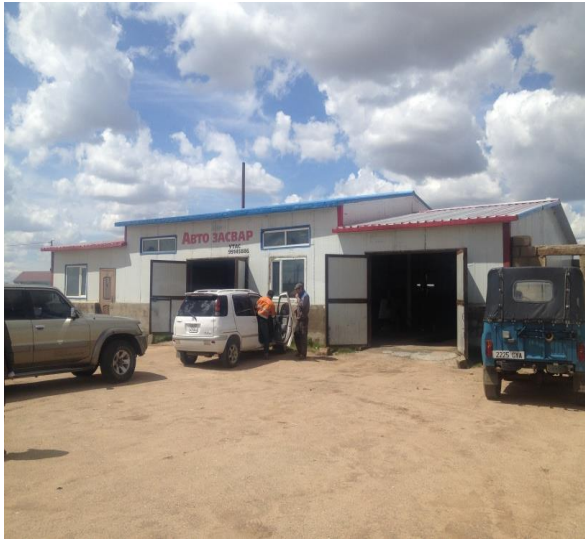
Сүхбаатар аймгийн авто засвар