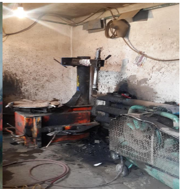
Налайх дүүргийн дугуй задлагч

2.5 “Үйлчилгээ-Оношлогоо-Хяналтын нэгдсэн систем”-ийн хүрээнд нийслэлд авто үйлчилгээ эрхлэгч 966 иргэн, байгууллагын мэдээлэл бүхий EXCEL санг үүсгэсэн.